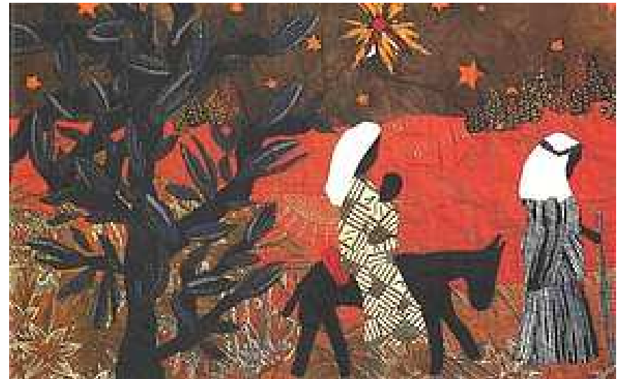
Birgit Raetzke „Difaem“ aus Ruanda